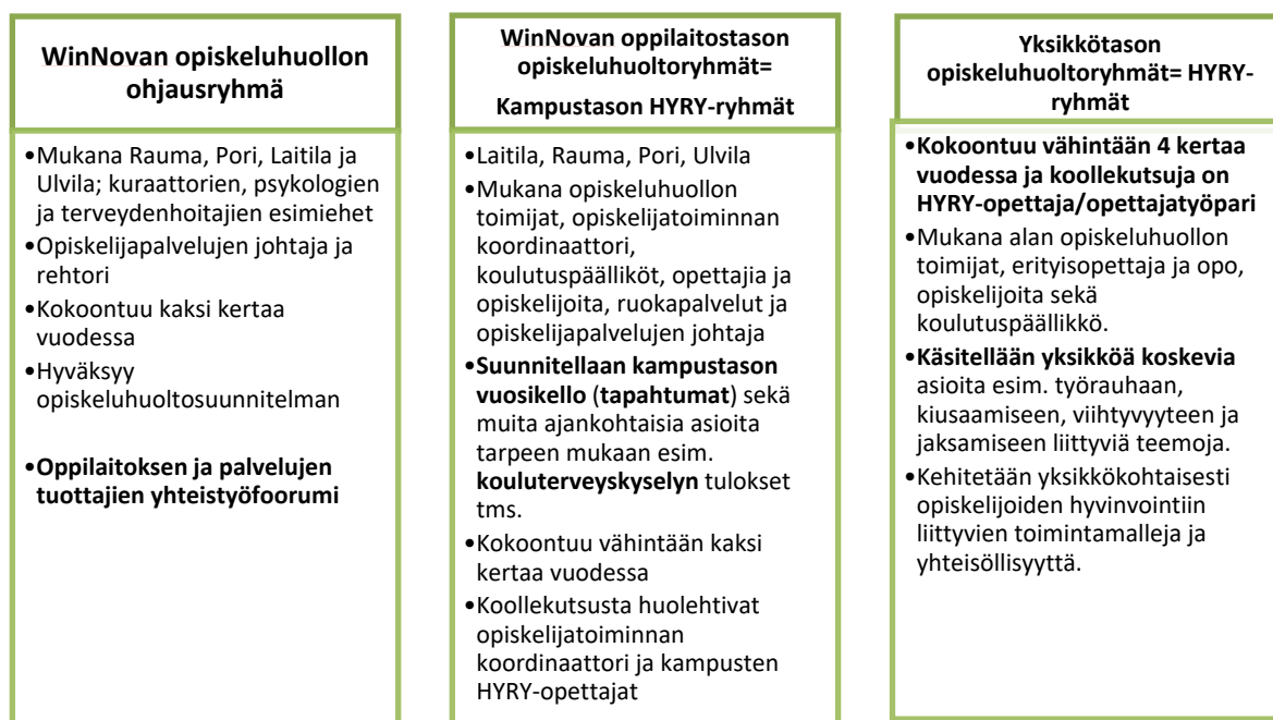
Kuva 2. WinNovan opiskeluhuollon toimintamalli